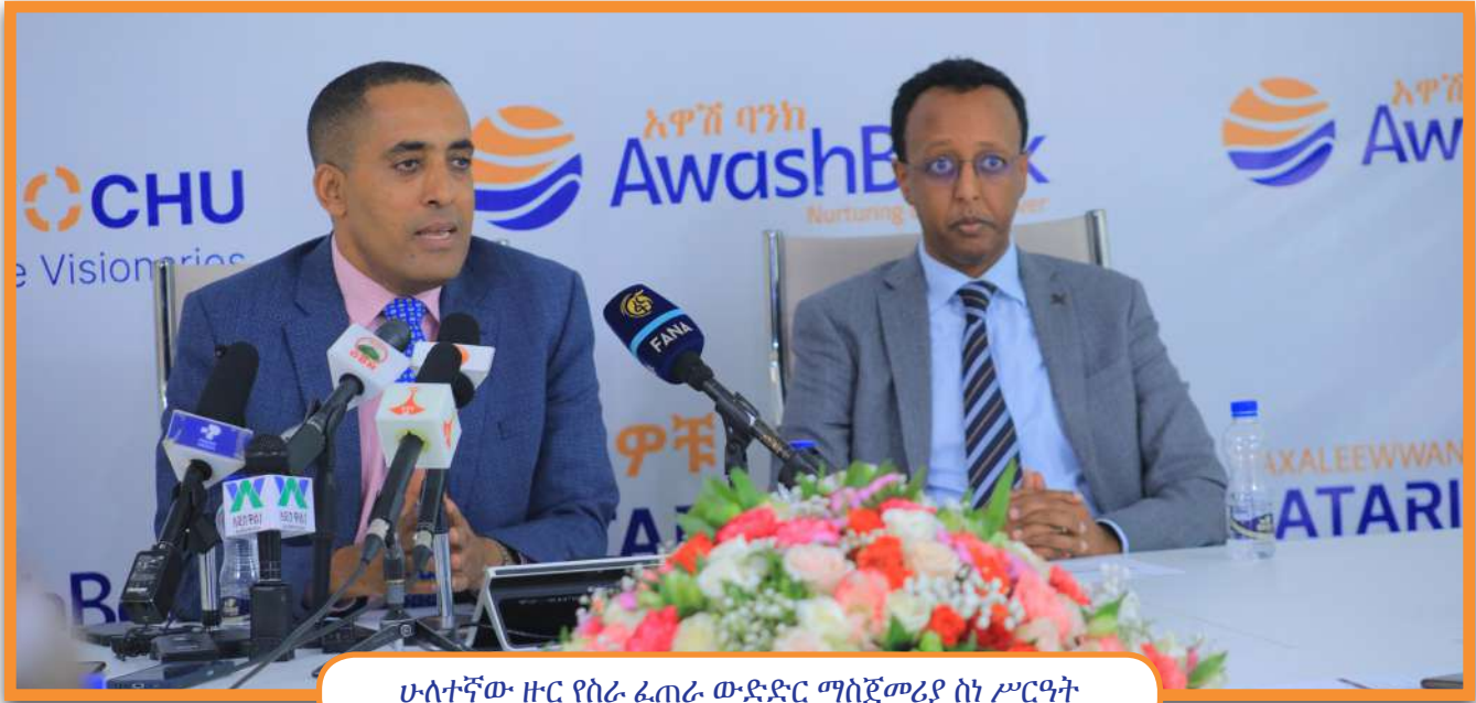
ሁለተኛው ዙር የስራ ፈጠራ ውድድር ማስጀመሪያ ስነ ሥርዓት

አዋሽ ባንክ ማህበራዊ ኃላፊነቱን ከመወጣት አኳያ ስራ ፈጣሪዎችንና ወጣት ትውልድን ለማበረታታትና ተገቢውን የፋይናንስ ድጋፍ ለማድረግ የሚያስችለውን ሁለተኛ ዙር ፕሮጀክት ቀርጾ ወደ ትግበራ መግባቱን መስከረም 24 ቀን 2016 ዓ.ም ይፋ አድርጓል።