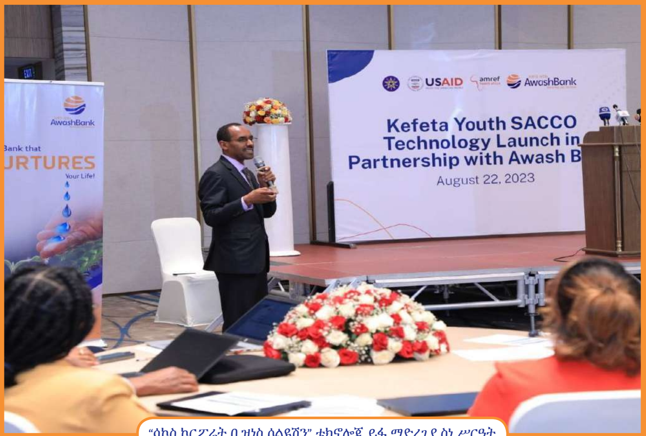
“ሳኮስ ኮርፖሬት ቢዝነስ ሶሊዩሽን” ቴክኖሎጂ ይፋ ማድረግ ስነ ሥርዓት

ይህንን በመረዳት አዋሽ ባንክ ላለፉት 29 ዓመታት ያካበተውን ልምድ በመጠቀም የገንዘብ ቁጠባና ብድር ህብረት ሥራ ማህበራትን አገልግሎት ቀልጣፋ ለማድረግ፣ ተደራሽነታቸውን ለማጎልበት፣ ብሎም በዘርፉ ተወዳዳሪ እንዲሆኑና የተቋቋሙበትን አላማ ማሳካት እንዲችሉ ለማድረግ ከአምራፍ ሄልዝ አፍሪካ ጋር በመተባበር ሳኮስ ኮርፖሬት ቢዝነስ ሶሊዩሽን (SACCOs Corporate Business Solution) የተሰኘ በዓይነቱ አዲስ የሆነ ሚኒ ኮር ባንኪንግ (Mini Core Banking) አበልፅጎ ያለ ምንም ክፍያ ለአገልግሎት አብቅቷል።