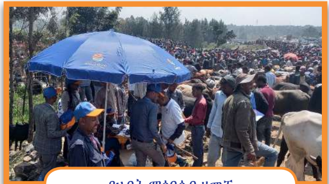
የሀብት ማሰባሰብ ዘመቻ

ሁላችንም ይህንን የምስራቅ አዲስ አበባ ቀጠና ጽ/ቤት ዘመቻ ዲጂታል እንቀላቀል!