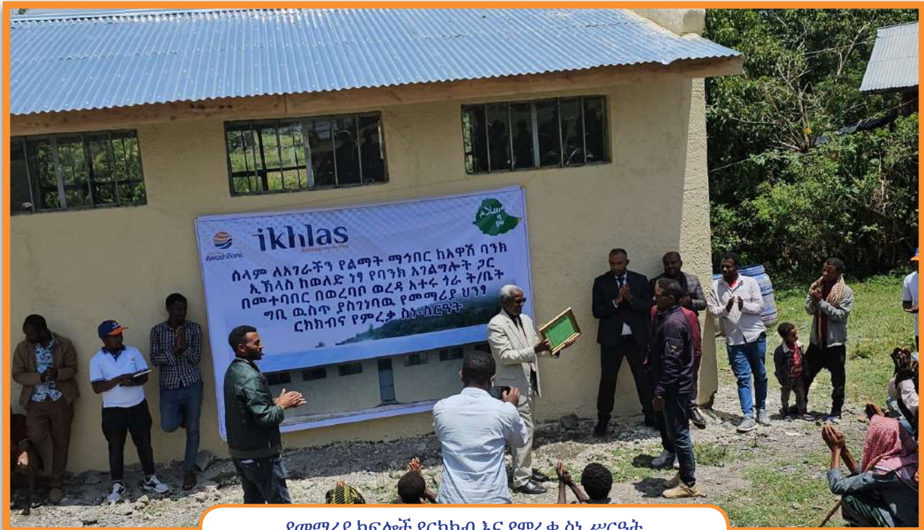
የመማሪያ ክፍሎች የርክክብ እና የምረቃ ስነ ሥርዓት

አዋሽ ባንክ ማህበራዊ ኃላፊነቱን ለመወጣት ስላም ለሀገራችን የልማት ማህበር ከተሰኘ ሀገር በቀል ድርጅት ጋር በመተባበር እና የፋይናንስ ድጋፍ በማድረግ በደቡብ ወሎ በወረባቦ ወረዳ አተሩ ጎራ ት/ቤት ግቢ ውስጥ ያስገነባውን ዘመናዊ የመማሪያ ክፍሎች ለማህበረሰቡ አስረክቧል።