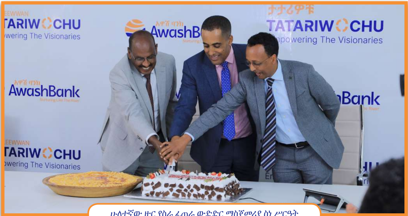
ሁለተኛው ዙር የስራ ፈጠራ ውድድር ማስጀመሪያ ስነ ሥርዓት

ወይንም በአፋን ኦሮሞ ማቅረብ ይችላሉ። የፈጠራ ሃሳባቸውንም የማመልከቻ ቅጽ ከአዋሽ ባንክ ድህረ-ገፅ፣ ፌስቡክ እና የቴሌግራም ገጾች እንዲሁም በአካል በመገኘት በሁሉም የባንኩ ቅርንጫፎች ላይ ማግኘት ይችላሉ። ለአዋሽ ባንክ የሥራ ፈጠራ ውድድር ከሚያመለክቱት ውስጥ ዝቅተኛውን መስፈርት የሚያሟሉ እጩ ተወዳዳሪዎች በሁሉም ክልሎች በተመረጡ የሥልጠና ማዕከላት እንዲሁም በአዲስ አበባና በድሬደዋ ከተሞች የክህሎት ስልጠና እንዲወስዱ እንደሚደረግም ተገልጿል።