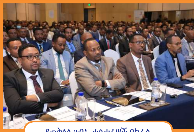
የጠቅላላ ጉባኤ ተሳታፊዎች በክፊል

በሌላ በኩል የባንኩ የደንበኞች የግንኙነት ማዕከል (Contact Center) ዓለም አቀፍ ደረጃውን በጠበቀ መልኩ Sound Proof፣ የሰራተኞች መዝናኛ፣ ካፍቴሪያ እና የተለያዩ ክፍሎች ያሉት በአዲስ መልክ አገልግሎት እንዲሰጥ መደረጉ በሪፖርቱ ተጠቅሷል።