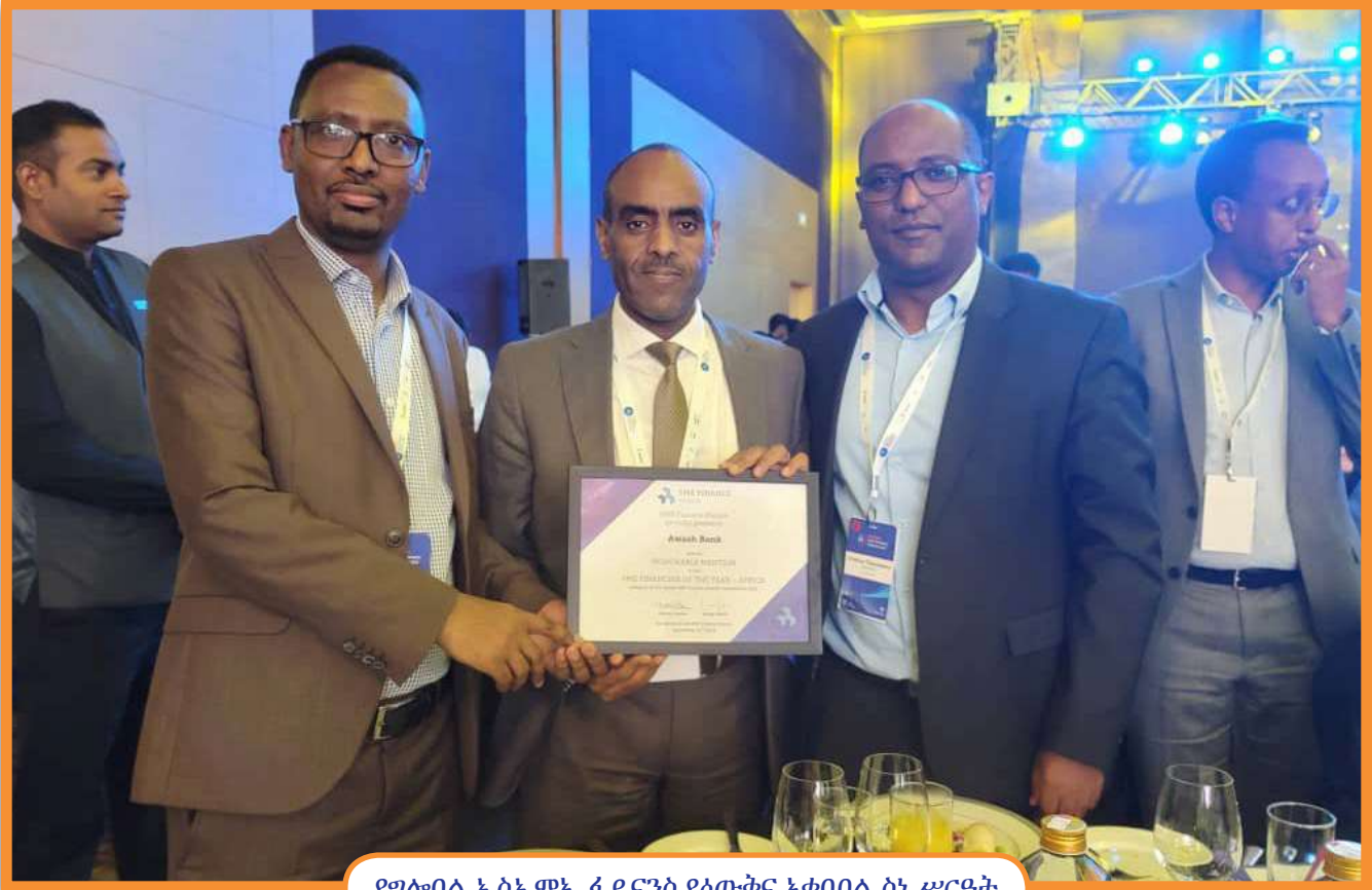
የግሎባል ኤስኤምኤ ፋይናንስ የዕውቅና አቀባበል ስነ ሥርዓት

አዋሽ ባንክ በ2023 ግሎባል ኤስኤምኤ ፋይናንስ ካስቀመጠው የሽልማት ዝርዝር ውስጥ በመጀመርያው ምድብ ማለትም የጥቃቅን አነስተኛና መካከለኛ ንግድ ዘርፍን ከፍተኛ መዋለ ንዋይ በማፍሰስ ዘርፉን በፋይናንስ በመደገፉ የዓለም አቀፍ ዕውቅናውን መቀዳጀት ችሏል።