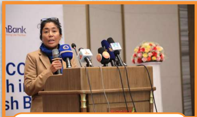
“ሳኮስ ኮርፖሬት ቢዝነስ ሶልዩሽን” ቴክኖሎጂ ይፋ ማድረጊያ ስነ ሥርዓት

የቁጠባና ብድር ህ/ስ/ማህበራት ለፋይናንስ አገልግሎት ተደራሽነት ዕውን መሆን ከፍተኛ ሚና ያላቸው ቢሆንም አሰራራቸውን ቀልጣፋና ዘመናዊ ለማድረግ የተለያዩ ተግዳሮቶች ይገጥማቸዋል። ለአብነት ለመጥቀስ ያክል በቴክኖሎጂ ያልተደገፈ የአባላት ምዝገባና አያያዝ፣ የሀብት አስተዳደር፣ የቁጠባ ሂሳብ አከፋፈትና አስተዳደር፣ የብድር አፈቃቀድ፣ አሰጣጥና አሰባሰብ ሁኔታዎች በዋነኝነት ተጠቃሽ ናቸው።