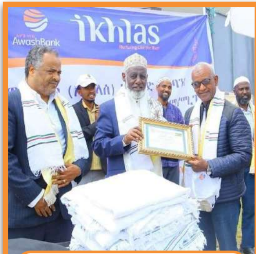
የህክምና መስጫ ማዕከል የርክክብ ስነ ሥርዓት

ባንኩ ከመደበኛው ስራ ጎን ለጎን የማህበረሰቡን ኢኮኖሚያዊ ተጠቃሚነት ለማረጋገጥ የማህበረሰቡን ችግር በመረዳት ዘርፈ ብዙ እገዛና ድጋፍ በማድረግ ላይ ይገኛል።