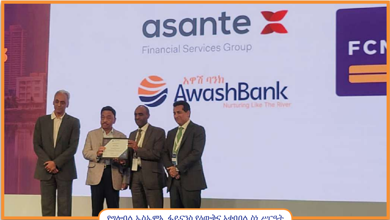
የግሎባል ኤስኤምኢ ፋይናንስ ዕውቅና አቀባበል ስነ ሥርዓት

አዋሽ ባንክ የጥቃቅን አነስተኛና መካከለኛ ንግድ ዘርፍን በመደገፍ ረገድ ላበረከተው አስተዋፅኦ ከግሎባል ኤስኤምኢ እ.ኤ.አ የ2023 ዕውቅና አግኝቷል።