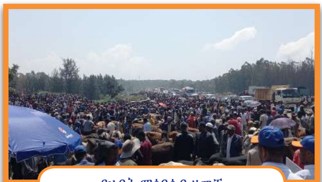
የሀብት ማሰባሰብ ዘመቻ

ጊዜው የውድድር ነው፤ በውድድሩ ትራክ ውስጥ ደግሞ ብርቱ ፋክከር አለ፤ ታዲያ በዚህ ውድድር መሪዎቻችንን እና አሸናፊዎቻችንን አስጠብቀን ለማስቀጠል ሁላችንም በተሰጠን የስራ ኃላፊነት ያለንን ክህሎትና ዕውቀት በመጠቀም የላቀ ውጤት በማስመዘገብ የነደፍነውን ዕቅድ ከግብ ለማድረስ እና የባንካችንን የ2030 ስትራቴጅክ ዕቅድ ለማሳካት በትጋት መስራት ይጠበቅብናል።