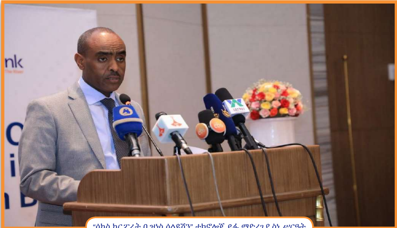
“ሳኮስ ኮርፖሬት ቢዝነስ ሶልዩሽን” ቴክኖሎጂ ይፋ ማድረጊያ ስነ ሥርዓት

አዋሽ ባንክ ከአምራፍ ኸልዝ ጋር በመተባበር በብድርና ቁጠባ ዘርፍ የበለፀገ አዲስ የፋይናንስ ቴክኖሎጂን ነሐሴ 16/2015 ዓ.ም በስካይ ላይት ሆቴል ይፋ አድርጓል።