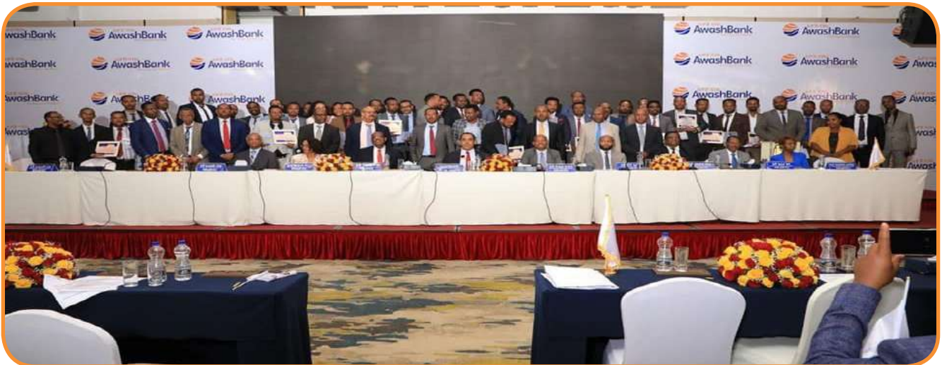
Annual Management Meeting