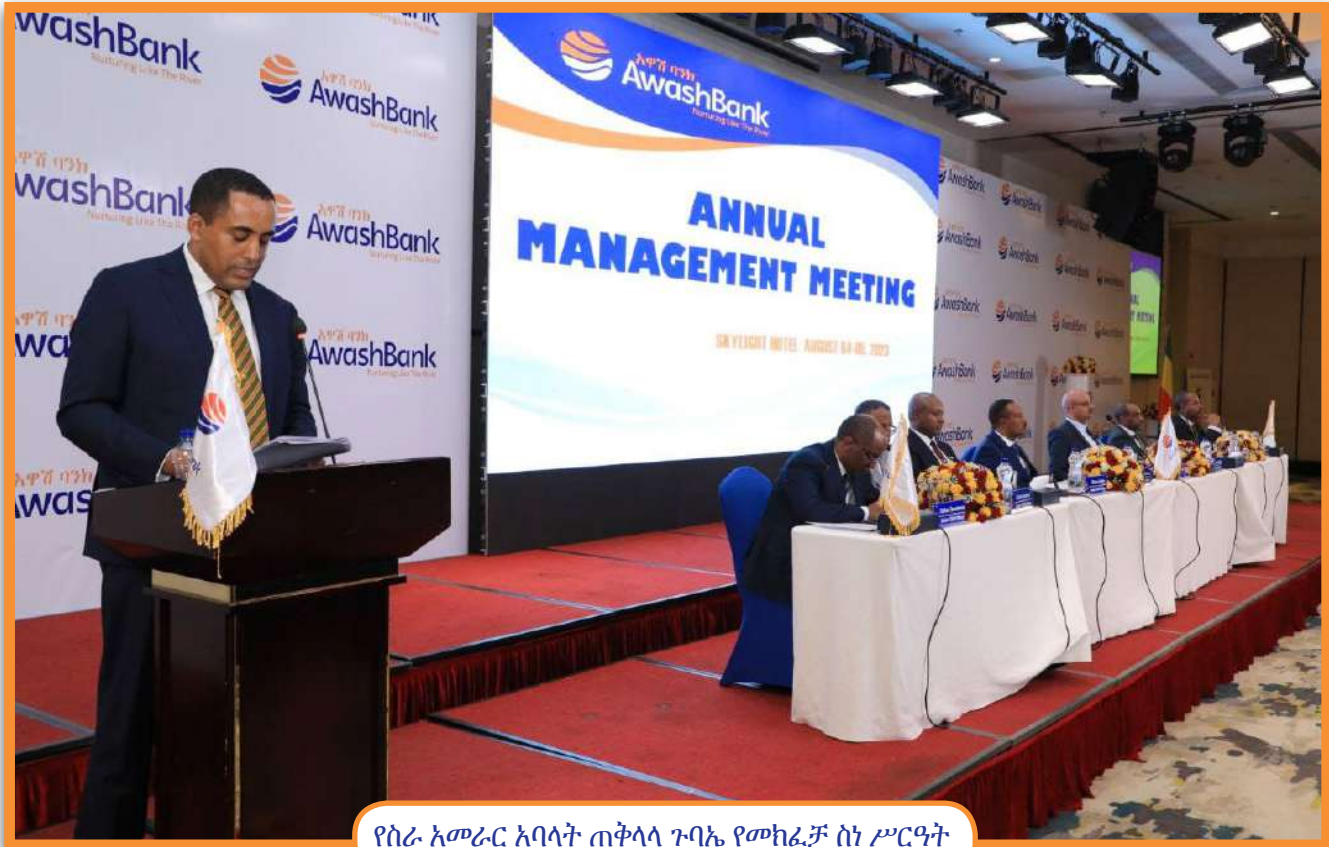
የስራ አመራር አባላት ጠቅላላ ጉባኤ የመክፈቻ ስነ ሥርዓት

አዋሽ ባንክ እኤአ የ2022/23 የሂሳብ ዓመት የስራ ክንውን ግምገማ እና የ2023/24 የሂሳብ ዓመት ስትራቴጅክ ዕቅድ ላይ ሐምሌ 28 እና 29 ቀን 2015 ዓ.ም በስካይ ላይት ሆቴል ውይይት አካሂዷል።