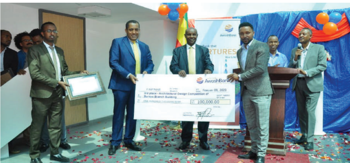
የዕውቅና ስነ ስርዓት በከፊል

አዋሽ ባንክ በቡራዩ፣ በወሊሶ እና በቢሾፍቱ ደረጃቸውን የጠበቁ ዘመናዊ አዳዲስ ህንጻዎች ሊያስገነባ ሲሆን የእነዚህ ህንጻዎች የአርክቴክቸራል ዲዛይን ውድድር አሸናፊ ለሆኑ ድርጅቶች ዕውቅና ሰጥቷል።