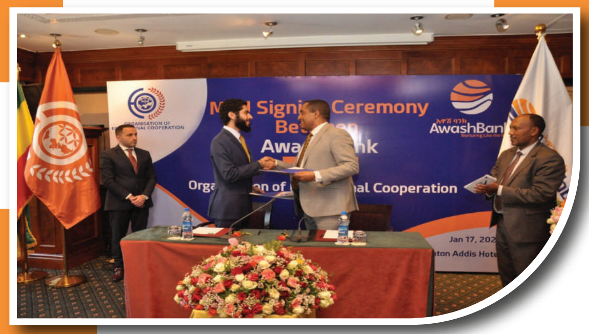
የመግባቢያ ስምምነት የፈርማ ስነ ስርዓት