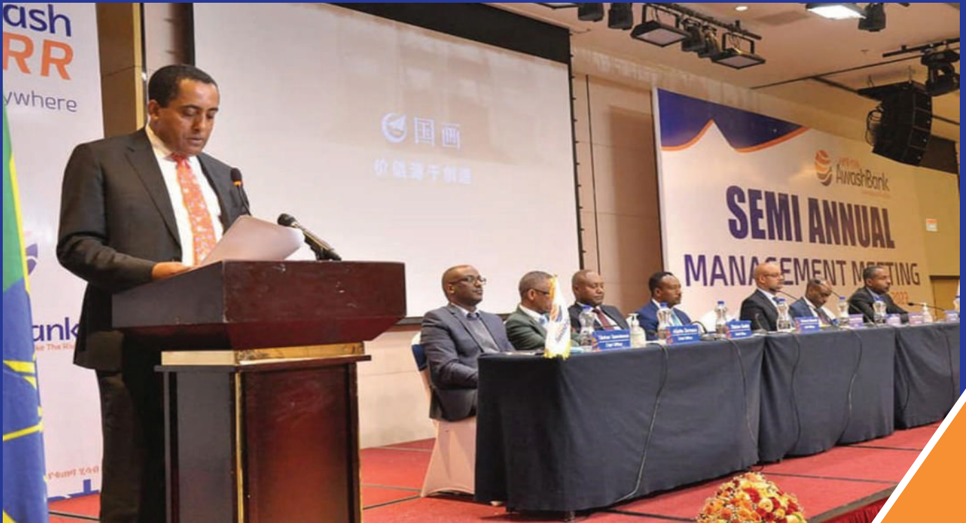
የመጀመሪያ መንፈቅ ሂሳብ ዓመት የሥራ አመራር ስብሰባ በክፍል

አዋሽ ባንክ በ2022/23 ሂሳብ ዓመት የመጀመሪያው መንፈቅ ዓመት ላይ በተከናወኑ ዋና ዋና ተግባራት እና ባጋጠሙ ችግሮች ላይ በመወያየት እና በቀሪው የሂሳብ ዓመት መከናወን በሚገባቸው ተግባራት ላይ በመመካከር ቀጣይ አቅጣጫዎችን ለማስቀመጥ የመጀመሪያው መንፈቅ ሂሳብ ዓመት የሥራ አመራር ስብሰባ ጥር 18 ቀን 2015 ዓ.ም በስካይ ላይት ሆቴል አካሂዷል።