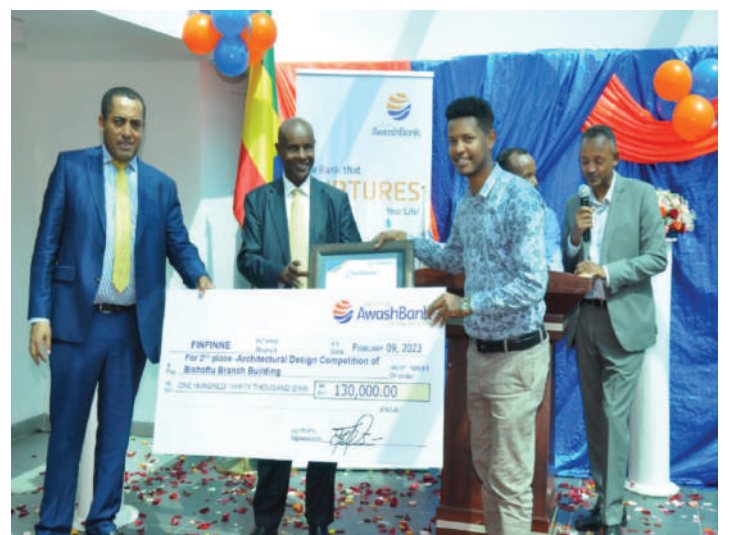
Architectural Design Competition Award for Burayu, Bishoftu and Woliso Building