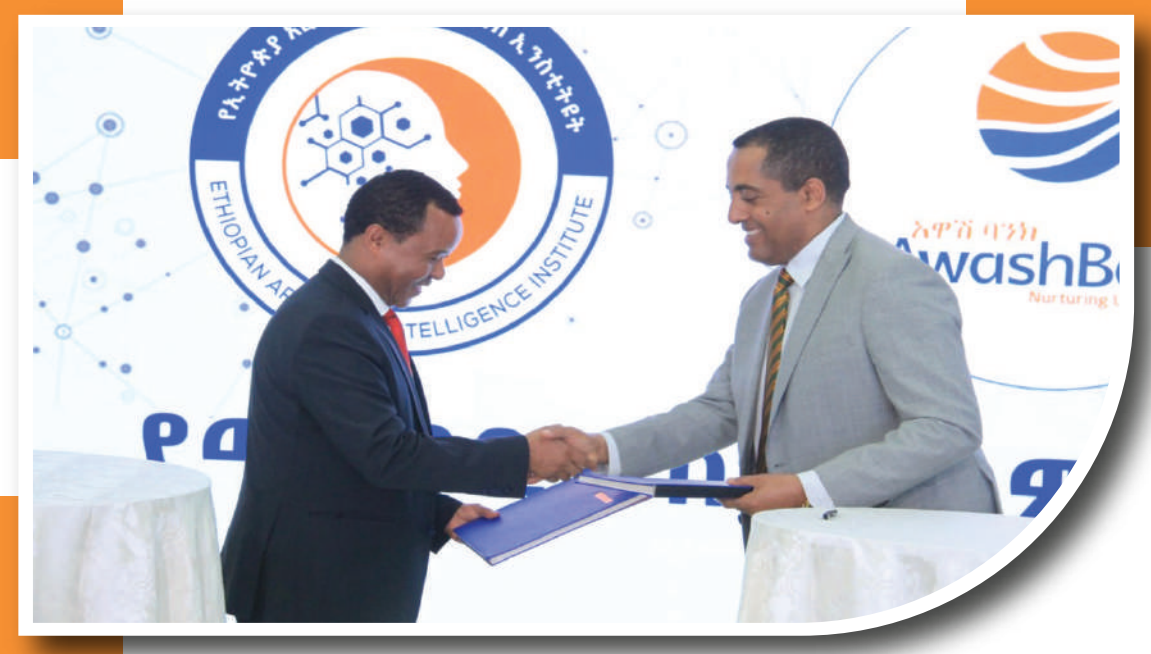
የመግባቢያ ስምምነት የፈርማ ስነ ስርዓት

በተመሳሳይ አዋሽ ባንክ ከኢትዮጵያ አርቲፊሻል ኢንተሊጅንስ ኢንስቲትዩት እና ከኦርጋናይዜሽን አፍ ኢጅኬሽናል ኮሎፕሬሽን ጋር አብሮ ለመስራት የሚያስችለውን የመግባቢያ ስምምነት ተፈራርሟል። የመግባቢያ ስምምነቱ አዋሽ ባንክ ለተቋማቱ አመራሮችና ሠራተኞች የውጭ ምንዛሬ አቅርቦትና በአነስተኛ ወለድ ምጣኔ የብድር አቅርቦት እንደሚያመቻች ተገልጿል።