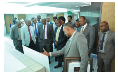
Architectural Design Competition Award for Burayu, Bishoftu and Woliso Building