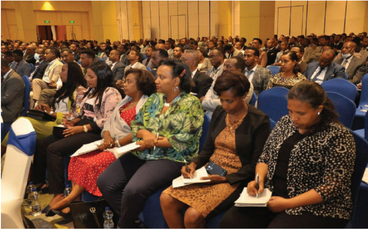
የስብሰባው ተሳታፊዎች በክፍል

የውጭ ምንዛሪ ግኝትን በተመለከተ ከአምናው ተመሳሳይ ወቅት ጋር ሲነፃፀር የ25 በመቶ ዕድገት ወይም የ158.3 ሚሊዮን የአሜሪካን ዶላር ጭማሪ በማሳየት እ.ኤ.አ ዲሴምበር 31, 2022 ላይ 783 ሚሊዮን የአሜሪካን ዶላር መሆን ችሏል።