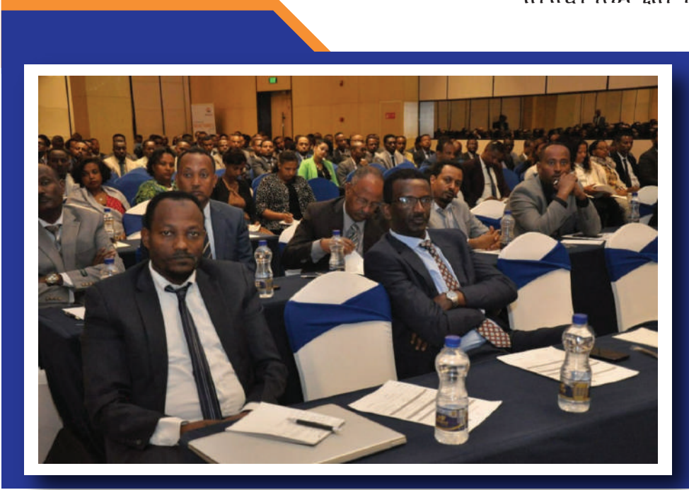
የሱብሰባው ተሳታፊዎች በከፊል

በቀረበው ሪፖርት ላይ በተደረገው ውይይት የመድርኩ ተሳታፊዎች በሰጡት አስተያየት በዕቅድ አፈጻጸም ወቅት ጥቃቅን ክፍተቶች መኖራቸው የተስተዋለ ቢሆንም እስካሁን በተገኘው ውጤት የባንኩ አቋም የተሻለ አፈጻጸም እንዳለውና መሪነቱን ለማስቀጠል ያሉትን ክፍተቶች በመሙላት የላቀ ውጤት ለማስመዘገብ በትኩረት እንደሚሰሩ ገልጸዋል።