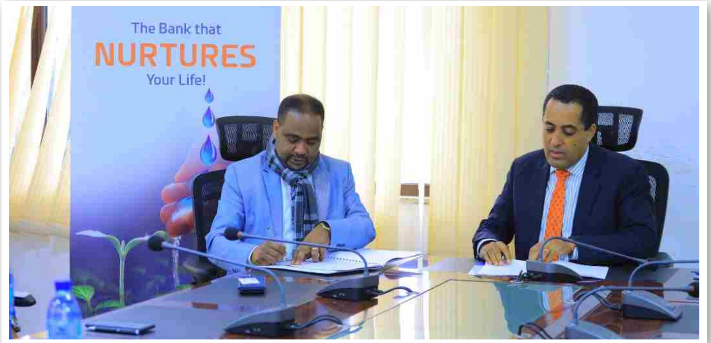
የመግባቢያ ፊርማ ሥነ-ሥርዓት በከፊል

አዋሽ ባንክ እና የኢንፎርሜሽን መረብ ደህንነት በጋራ ለመስራት የሚያስችላቸውን የመግባቢያ ስምምነት ሐምሌ 26/2014 ዓ.ም ተፈራርመዋል።