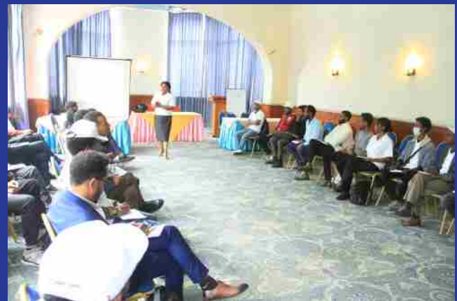
ለታታሪዎቹ የተሰጠው የመጀመሪያ ዙር ስልጠና በከፊል