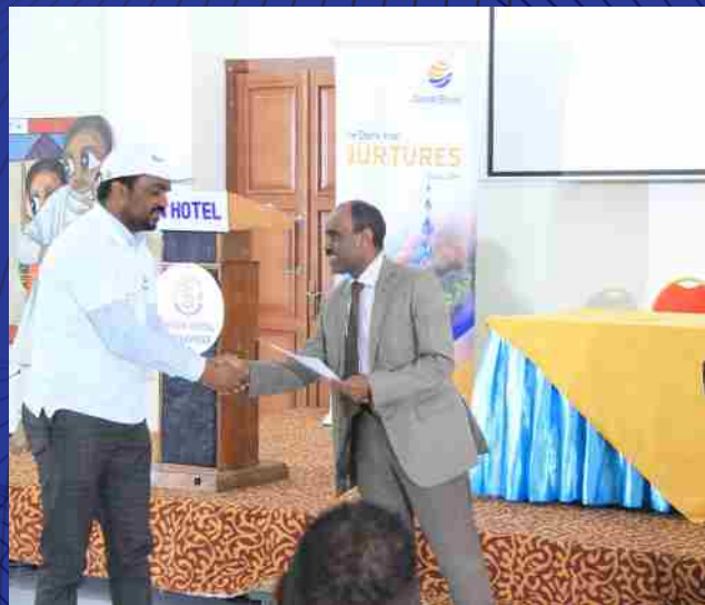
የመጀመሪያ ዙር የታታሪዎች ስልጠና ተሳታፊዎች