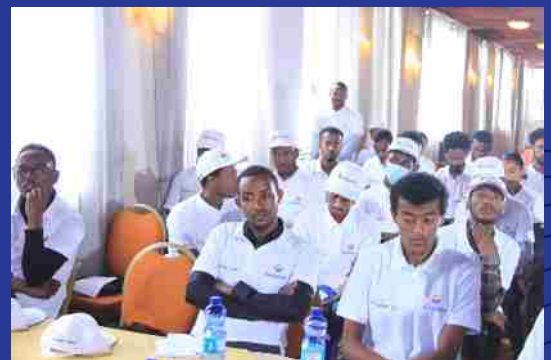
ለታሪካዎቹ የተሰጠው የመጀመሪያ ዙር ስልጠና የመዝናኛ ፕሮግራም በካሬ