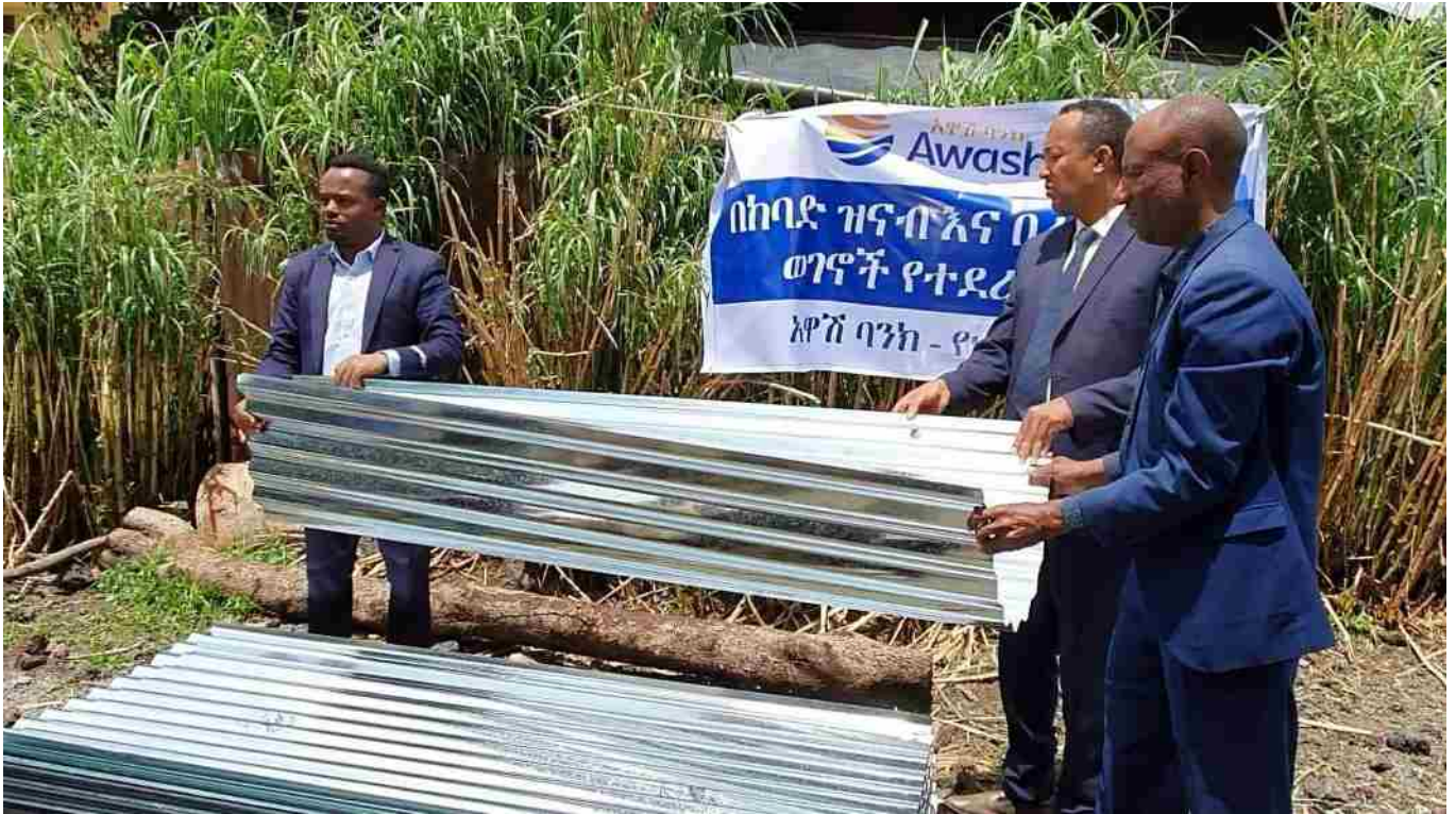
ለአርሶ አደሮች የተደረገው የድጋፍ ሥነ-ሥርዓት በከፊል

ለማህበረሰብ መቆራረጥን አንኳር እሴቱ ያደረገው አዋሽ ባንክ በምዕራብ ጎጃም ዞን ሰሜን ሜጫ ወረዳ በከባድ ዝናብ ቤታቸው ለወደመጣቸው አርሶ አደሮች የቆራረጥ ድጋፍ አድርጓል።