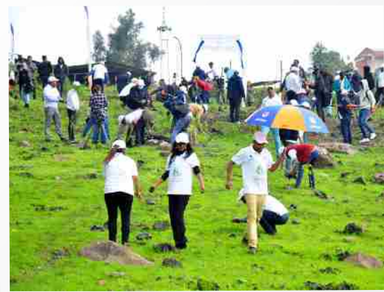
የአረንጓዴ አሻራ ሥነ-ምርጫ በከፊል

የእህት ኩባንያዎቹ አዋሽ ባንክ እና አዋሽ ኢንሹራንስ ሠራተኞች ሐምሌ 26 ቀን 2014 ዓ.ም ከአዲስ አበባ ከተማ አስተዳደር ለሚ ኩራ ክ/ከተማ ወረዳ 02 ፅ/ቤት ጋር በመተባበር 20 ሺህ ችግኞችን በመትከል አረንጓዴ አሻራቸውን አኑረዋል።