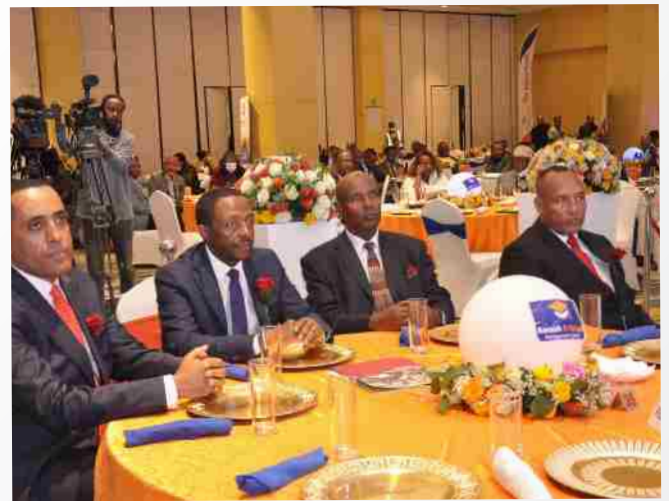
የኢ-ስኩል የመክፈቻ ሥነ-ሥርዓት በከፊል