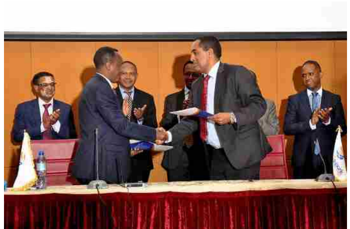
የፊርማ ሥነ-ሥርዓት በከፊል

አዋሽ ባንክ መካከለኛ፣ አነስተኛና ጥቃቅን ኢንተርፕራይዞች የፋይናንስ አቅርቦት እንዲያገኙ ከዘጠኝ አነስተኛ ፋይናንስ ተቋማት ጋር የብድር አቅርቦት ስምምነት አድርጓል። ባንኩ ይህን ስምምነት ያደረገው ዘጠኙ የአነስተኛ ፋይናንስ ተቋማትም፡- ቪኸን ፈንድ፣ ንስር፣ ቀንዲል፣ መተማመን፣ መክሊት፣ ዳይናሚክ፣ ዋሳሳ፣ ሃርቡ እና ፒስ ማይክሮፋይንስ አ.ማ ይገኙበታል።