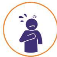
የትንፋሽ ማጠር Trouble Breathing