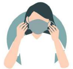
አፍን መሸፈን Use face mask