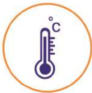
ትኩሳት High Fever