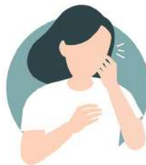
ባልታጠበ እጅ ፊትዎን አለመንካት Avoid touching Eyes, Nose & Mouth