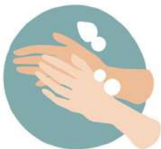
እጅ በሳሙና መታጠብ Wash your hands with soap & water