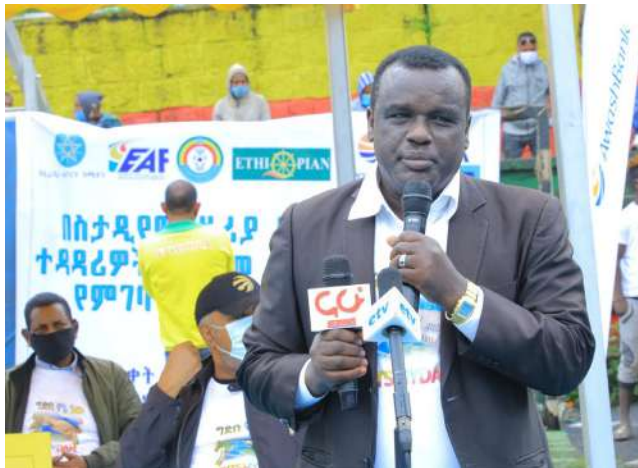
የ4ኛው ዙር የመገደ ማጋራት ሥነ-ሥርዓት

አዋሽ ባንክ የኢ.ፌ.ዴ.ሪ ስፖርት ኮሚሽን፣ የኢትዮጵያ እግር ኳስ ፌዴሬሽን፣ የኢትዮጵያ አትሌቲክስ ፌዴሬሽን እንዲሁም ሌሎች አጋር ድርጅቶች በጋራ በመሆን በአዲስ አበባ ትንሿ ስታዲየም ነሀሴ 2 ቀን 2012 ዓ.ም ላስጆመራት 4ኛው ዙር የምገባ ፕሮግራም የብር 200 ሺህ ድጋፍ አደረገ።