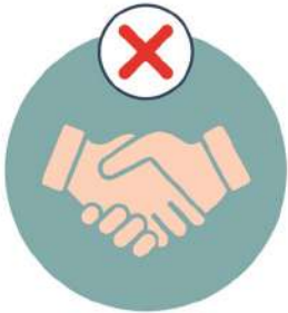
አለመጨባበጥ do not shake hands