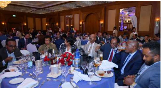
በሥነ-ስርዓቱ ላይ የታደሙ እንግዶች በከፊል

ይህ የስኬት ታሪካቸውም አህት ኩባንያዎቹ ለወደፊት የገቢያ ድርሻ ማስፋቱን ይበልጥ እንዲያጠናክሩ እና በአገልግሎቶቻቸው በህዝቡ ልብ ውስጥ ዘልቆ በመግባትና የበለጠ በራስ የመተማመን ስሜት ለመፍጠር እንደሚያስችላቸው ታምናታል።