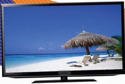
2ኛ ዕጣ - አል ኢዲ ቴሌቭዥኖች