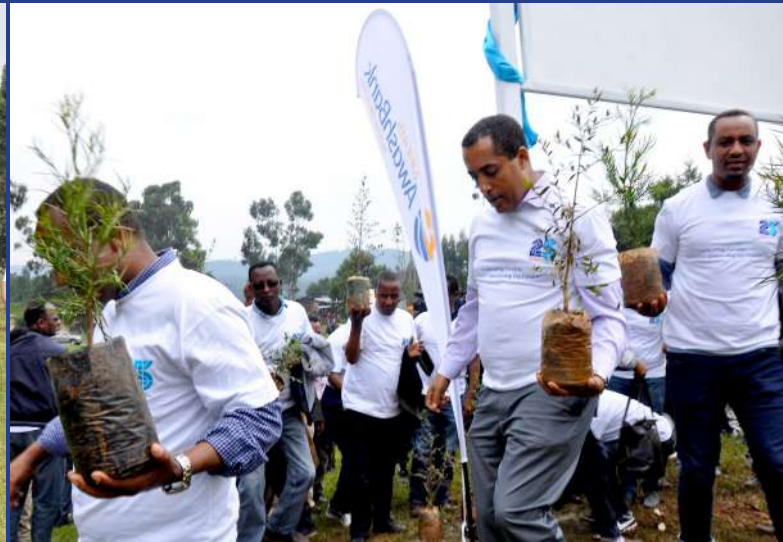
AB's & AIC staff engaged in planting trees for 25 th year anniversary