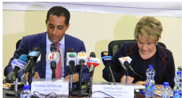
Partnership signing ceremony

The U.S. Agency for International Development (USAID) and Awash Bank have announced a new partnership that will make up to US $6.4 million in financing available to microfinance institutions and small- and medium-sized agricultural businesses in Ethiopia.