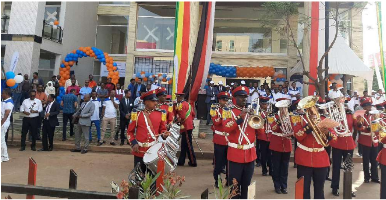
በሕንፃው ምርቃት ላይ የተደረገ የማርሽ ባንድ ትርዒት

አዋሽ ባንክ በጅማ ከተማ በአምስት ቅርንጫፎች አገልግሎት በመስጠት ላይ ይገኛል ያሉት ዋና ስራ አፈጻሚው፣ በዚህች የደቡብ ምዕራብ ኢትዮጵያ ፈርሞ በሆነችው ከተማ ሕንፃ ለመገንባት የተፈለገበት ዋናው ምክንያትም ከተማዋ በአገራችን በጎንጎድ ማዕከልነት ከሚታወቁት ከተሞች አንዷ ከመሆኗም በላይ የባንኩ ሥራ በከፍተኛ ሁኔታ ከሚካሄድባቸው ከተሞች መካከል አንዷ መሆኗን ጭምር አስረድተዋል።