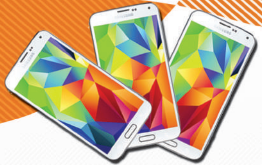
4ኛ ዕጣ - ተንቀሳቃሽ የስልክ ቀፎዎች