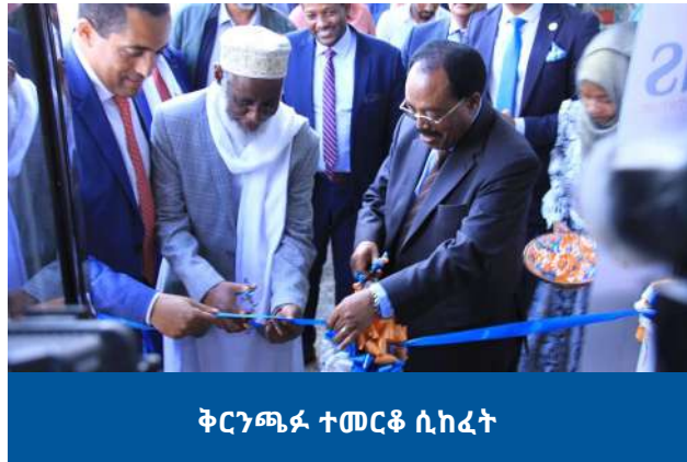
ቅርንጫፍ ተመርቆ ሲከፈት

አዋሽ ባንክ ግዳር 11 ቀን 2012 ዓ.ም. ከወለድ ነፃ የባንክ አገልግሎት የሚሰጥ ቅርንጫፍ አዲስ አበባ ቤተል አካባቢ የባንኩ ከፍተኛ የስራ አመራር አባላትና ጥሪ የተደረገላቸው እንግዶች በተገኙበት በደማቅ ስነስርዓት በመክፈት ለሙሉ ለሙሉ የህብረተሰብ ክፍል አገልግሎት በመስጠት ላይ ይገኛል።