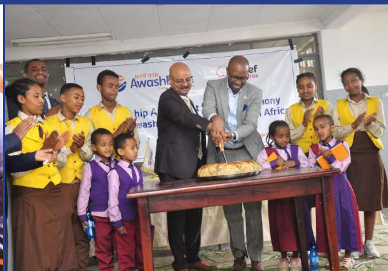
AB's and Amref Health Africa partnership celebration at Belay Zelek primary school