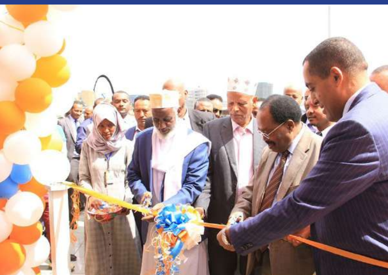
Opening ceremony of 'Ikhlas' new interest free banking branches