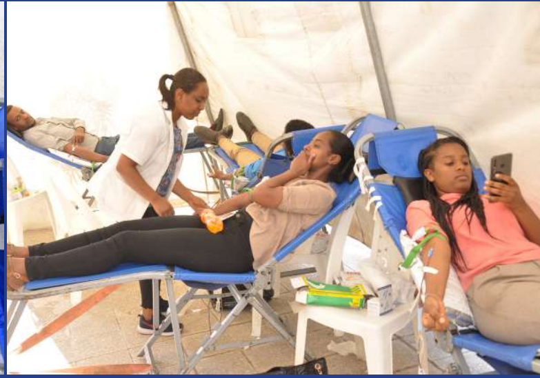
AB's & AIC staff participated on blood donation for the 25 th year anniversary