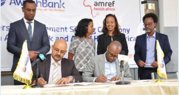
Partnership signing ceremony

Awash Bank, the leading private bank in Ethiopia and Amref Health Africa, the largest Africa based international non-governmental organization (NGO) signed a long term partnership agreement to work jointly towards improving the health and well-being of Ethiopians, support progress towards Universal Health Coverage (UHC) and collaborate to narrow gender inequity gaps across Ethiopia.