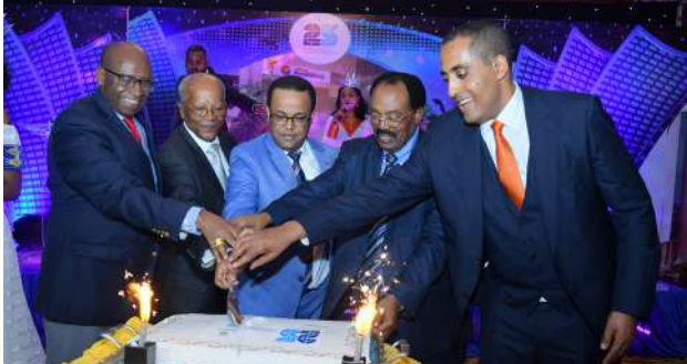
የአለቱ የክብር እንግዳ ዶ/ር ይናገር ደሴ በተገኙበት የተደረገ የኬክ ቆረሳ ሥነ-ሥርዓት

አህት ኩባንያዎቹ የ25ኛ ዓመት የልደት በዓል ሻማቸውን የለኮሱት ከፍተኛ የመንግስት ባለሥልጣናት፣ ባለአክሲዮኖች፣ የዳይሬክተሮች ቦርድ አመራሮችና አባላት እንዲሁም የሁለቱም ኩባንያዎች የማኔጅመንት አባላት እና ጥሪ የተደረገላቸው እንግዶች በተገኙበት በመከላከያ ሰራዊት የማርሽ ባንድ ትዕይንቶች በመታጀብ ነበር።