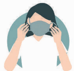
አፍን መሸፈን Use face mask