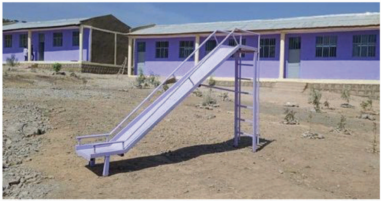
በአዋሽ ባንክ የፋይናንስ ድጋፍ የተገነቡ የመማሪያ ክፍሎች በክፍል

አዋሽ ባንክ የካናዳ ክርስቲያን ህፃናት ፈንድ ከተሰኘ ግብረ ሰናይ ድርጅት ጋር በመተባበር በአዳማ ከተማ ከኢትዮጵያ ሱማሌ ክልል ለተፈናቀሉ ህፃናት የተሟላ የመጠጥ ውሃና ዘመናዊ መጻዳጃ ቤቶች እንዲሁም የህፃናት መጫወቻዎች ያሏቸው የመማሪያ ክፍሎችን አስገነባ።