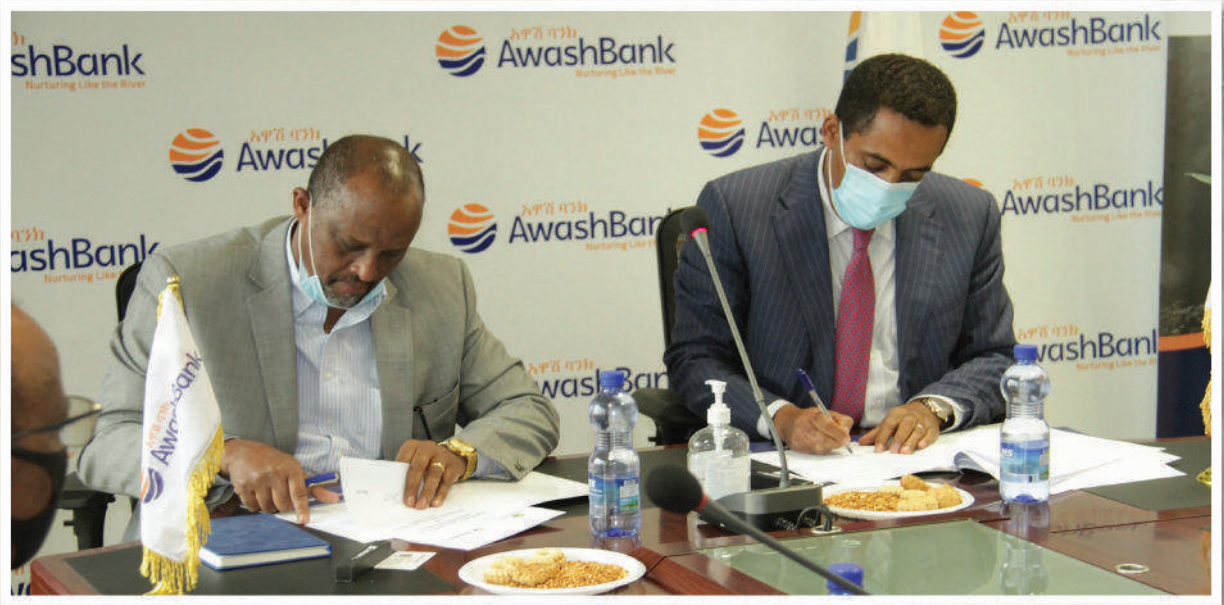
የመግባቢያ ስነዱ የፊርማ ሥነ-ሥርዓት በክፍል

አዋሽ ባንክ ከኢትዮጵያ የወንጌል አማኞች አቢያተ ክርስቲያናት ካውንስል ጋር አብሮ መስራት የሚያስችለውን የመግባቢያ ስምምነት ተፈራረመ።