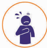
የትንፋሽ ማጠር Trouble Breathing