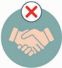
አለመጨባበጥ do not shake hands