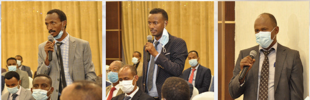
Pictorial Memory of Semi-Annual Management Meeting at Elilly Hotel