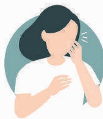
ባልታጠበ እጅ ፊትዎን አለመንካት Avoid touching Eyes, Nose & Mouth