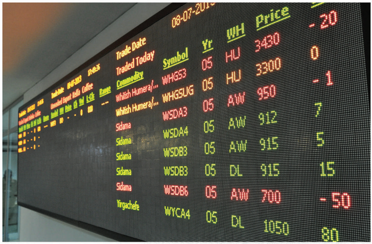
ከኢትዮጵያ ምርት ገበያ ግብይት የተወሰደ

የመጋዘን ደረሰኝ ብድር አንድ አምራች ወይም ተገቢያዊ ምርቱን ወደ ኢትዮጵያ ምርት ገበያ መጋዘን በማስገባትና የመጋዘን ደረሰኙን (WR) እንደ ማስያዣ በመጠቀም ከምርት ገበያው ጋር በጣምራ ከሚሰሩ ባንኮች የብድር አገልግሎት የሚያገኝበት አሰራር ነው።