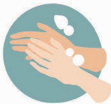
እጅ በሳሙና መታጠብ Wash your hands with soap & water