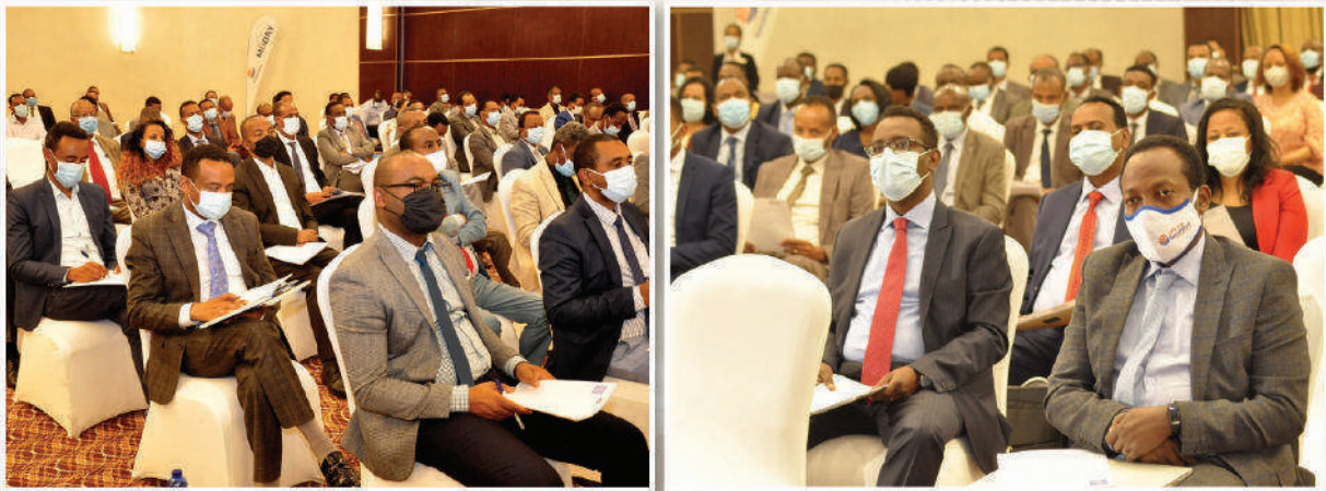
የጉባኤው ተሳታፊዎች በከፊል

ከባንኩ የፋይናንስ አፈፃፀም አንጻር እ.ኤ.አ ዲሴምበር 2020 መጨረሻ ላይ የባንካችን ጠቅላላ የተቀማጭ ሂሳብ 87.1 ቢሊዮን የነበረ ሲሆን ይህም አሃዝ ከተቀመጠው እቅድ አንጻር የብር 3.5 በመቶ ቅናሽ ማሳየቱንና ለዚህም ብቸኛው ምክንያት የቁጠባ ሂሳብ አሰባሰባችን ላይ የሚታዩ ክፍተቶች መሆናቸውን ጠቁመው የተሻለ ውጤት ማምጣት እንዲቻል ከሁሉም ባለድርሻ አካላት ጋር ተቀናጅቶ መስራት እንደሚያስፈልገው አስገንዝበዋል።